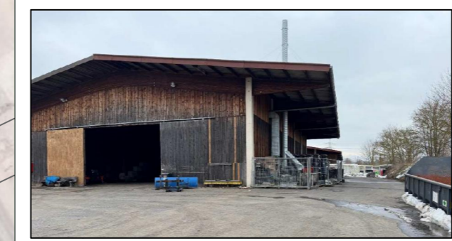
im Bestand vorhandene Lagerhalle

Innerhalb des Plangebietes sind bereits Lagerflächen und eine Lagerhalle im Bestand vorhanden. Diese bleiben erhalten und werden weiterhin als Lagerfläche genutzt. Durch die bereits verfügbaren Flächen ist eine weitere Bebauung oder Überbauung der Grundstücksfläche nicht geplant.