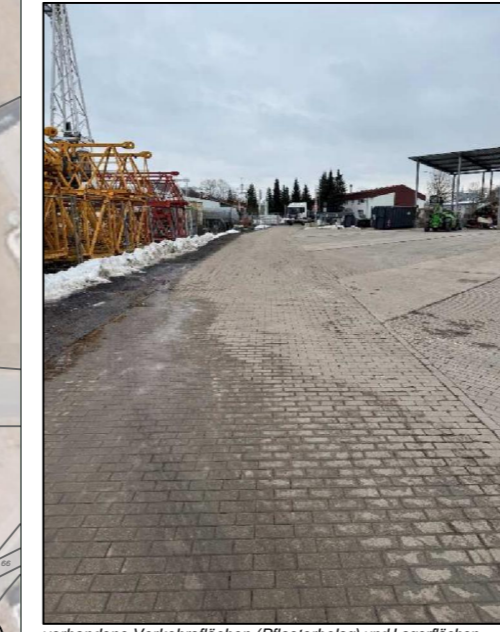
vorhandene Verkehrsflächen (Pflasterbelag) und Lagerflächen des Plangebietes