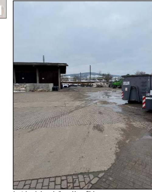
bestehende Lagerhalle und Lagerfläche