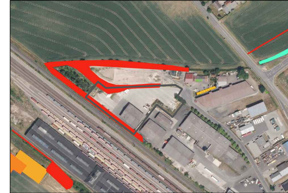
Abbildung Biotop mit Geltungsbereich

Sowohl die Gehölzstrukturen als auch die Grünflächen sind zu erhalten und zu pflegen.